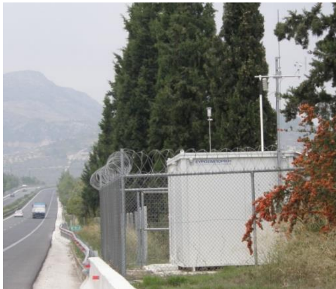
Εικόνα 4: Άποψη του ΜΣΜ Σολομού Κορινθίας (Χ.Θ. 90+930).

Τα αποτελέσματα των παρακολουθήσεων υποβάλλονται σε τριμηνιαίες εκθέσεις στις αρμόδιες Αρχές.