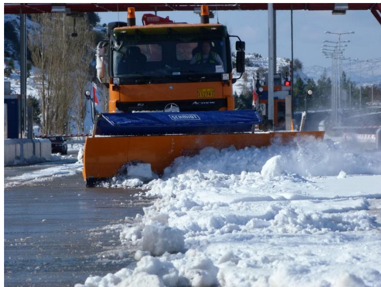
Εικόνα 3: Εργασίες εκχιονισμού σε εξέλιξη.

Οι περιοχές Στέρνας, Αρτεμισίου και διάβαση Καλογερικού είναι περιοχές υψηλής συχνότητας εμφάνισης χιονόπτωσης και για το λόγο αυτόν η ΜΟΡΕΑΣ Α.Ε. είναι σε ετοιμότητα για την αντιμετώπιση των χιονοπτώσεων.