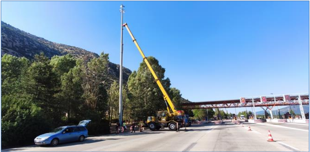
Εικόνα 5: Εργασίες για την εγκατάσταση νέων φωτιστικών σωμάτων τύπου LED στον Σταθμό Διοδίων Νεστάνης (Χ.Θ. 146+800).

Στο πλαίσιο πληρέστερης και ενιαίας αντιμετώπισης των περιβαλλοντικών και ενεργειακών θεμάτων, η MOPEAS Α.Ε. εκτός από το Σύστημα Περιβαλλοντικής Διαχείρισης, εφαρμόζει και Σύστημα Ενεργειακής Διαχείρισης πιστοποιημένο κατά ISO 50001:2018. Η ανάπτυξη, διατήρηση, εφαρμογή και τεκμηριωμένη παρακολούθηση των δύο πιστοποιημένων Συστημάτων, διασφαλίζει τον περιορισμό του περιβαλλοντικού αποτυπώματος της MOPEAS Α.Ε. συγχρόνως με την επίτευξη του στόχου διαρκούς βελτίωσης και συμμόρφωσης με τις απαιτήσεις των περιβαλλοντικών αδειοδοτήσεων.