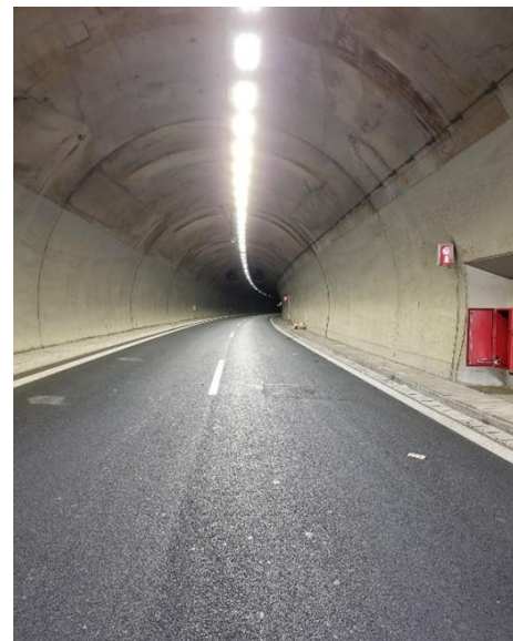
Εικόνα 6: Ενεργειακή αναβάθμιση της σήραγγας Νεοχωρίου (Φιλελλήνων – Χ.Θ. 135) με νέα φωτιστικά σώματα τύπου LED.