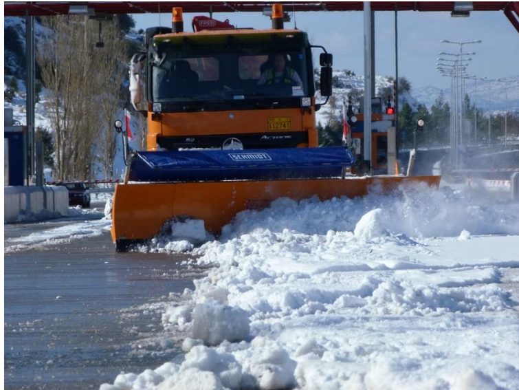
Εικόνα 3: Εργασίες εκχιονισμού σε εξέλιξη.

Οι περιοχές Στέρνας, Αρτεμισίου και διάβαση Καλογερικού είναι περιοχές υψηλής συχνότητας εμφάνισης χιονόπτωσης και για το λόγο αυτόν η ΜΟΡΕΑΣ Α.Ε. είναι σε ετοιμότητα για την αντιμετώπιση των χιονοπτώσεων.