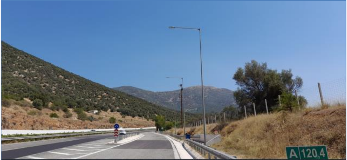
Εικόνα 5: Νέα φωτιστικά σώματα τύπου LED σε χώρο στάθμευσης (Χ.Θ. 120+400).

Στην κατεύθυνση της συνεχούς βελτίωσης των περιβαλλοντικών και ενεργειακών δεικτών εντός των ορίων του Έργου Παραχώρησης, κατά το πρώτο εξάμηνο του 2023 υλοποιήθηκε δράση αντικατάστασης 120 φωτιστικών σωμάτων παλαιότερης τεχνολογίας (Νατρίου υψηλής πίεσης - Na Υ.Π.) στο σύνολο των χώρων στάθμευσης (parking) του Αυτοκινητόδρομου με φωτιστικά σώματα νέας τεχνολογίας, τύπου LED (Εικόνα 5).